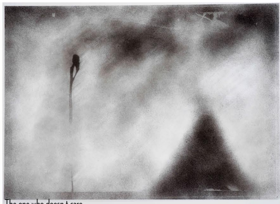
The one who doesn't care